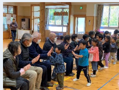
▲こども園とサロンの交流

皆さまからいただきました会費は、高齢の方、障がいのある方、子どもたちの様々な活動のほか、地域福祉推進のための活動費として大切に使用させていただきました。ありがとうございました。