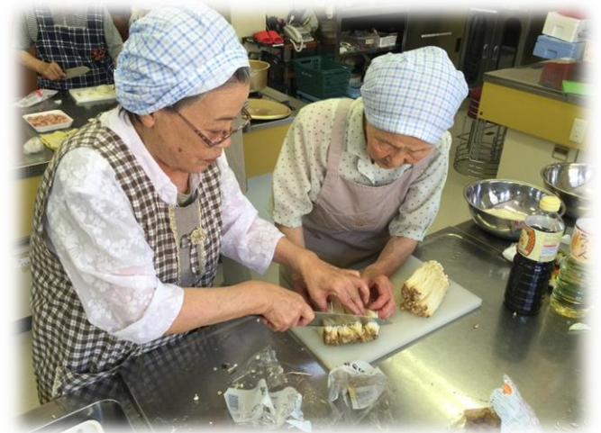
日義地区「ぽっかぽか」の様子