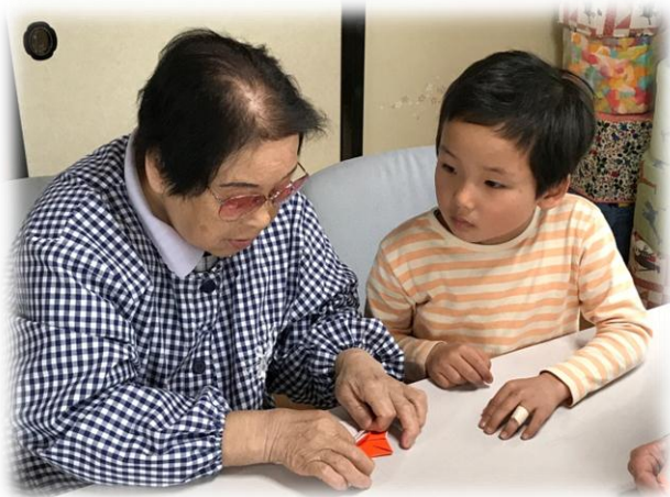
三岳地区「和み家」の様子