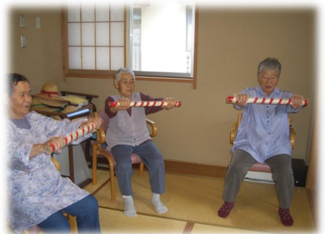
開田地区「陽だまり」の様子