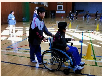
福祉教育推進事業