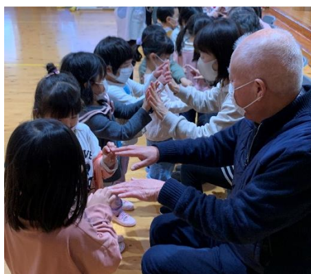
▲子ども園サロン交流

皆様から納入いただきました会費は、高齢の方、障がいのある方、子どもたちなどの様々な活動のほか、地域福祉の推進のための活動費等の財源として大切に使用させていただきました。ありがとうございました。