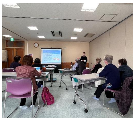
▲ボランティアフォローアップ講座