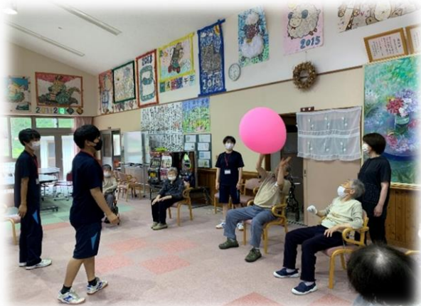
デイサービスでレクリエーションに参加