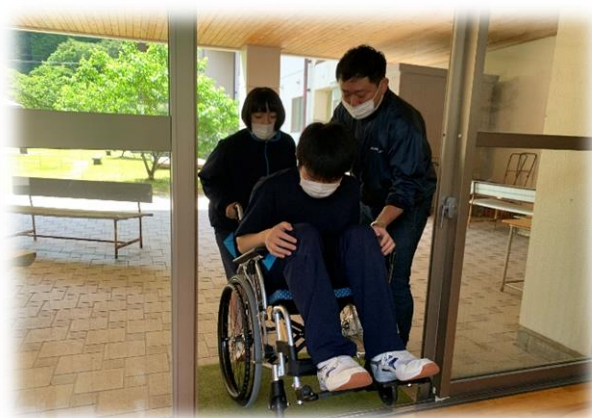
車椅子体験 段差での操作指導