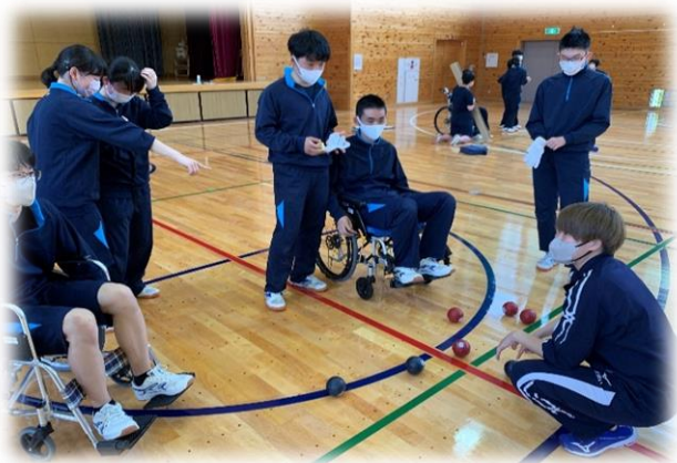
疑似体験しながらボッチャの試合

木曽町中学校3年生が5月から高齢者や障がい者について理解するための「福祉体験学習」を各テーマに沿って3回行ってきました。1回目は、「福祉とは？」をテーマに「ふ」だんの「く」らしの「し」あわせがとても大切であることやみんなが幸せに暮らせる社会（共生社会）について学び、2回目は車いす体験とハンデを疑似で体験しながら障がい者スポーツのボッチャを体験し、障がいの違いによって「楽しみかた」に違いがあることや「みんなと一緒に楽しむ方法」などを知ることができました。そして3回目は高齢者福祉施設と地域サロンを訪問して交流を行いました。施設では水分補給の準備やレクリエーションに参加したり、シーツ交換や環境整備などのボランティア活動も行いました。また、サロンでは季節の味、朴葉巻や朴葉寿司などをサロンの方々と一緒に作りました。3回の体験学習をとおして、みんなが幸せに暮らせるためにはどのように人と接すれば良いかを学ぶことができた良い体験学習となりました。