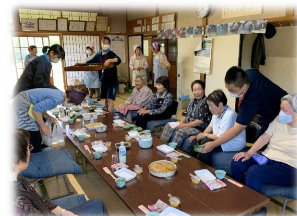
大原サロン 相撲の話で盛り上がる