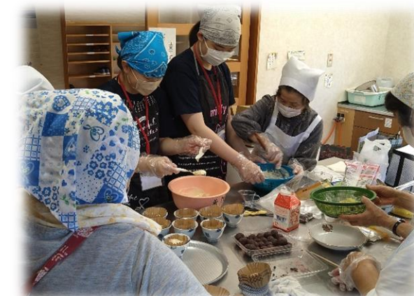
桑原サロン 蒸しパン作り