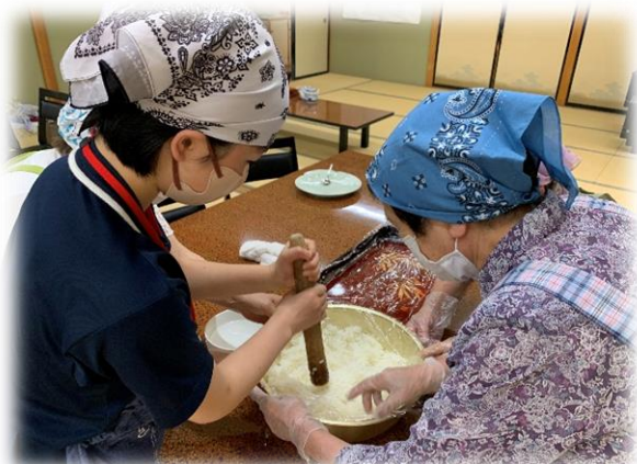
上中入サロン 五平餅作り