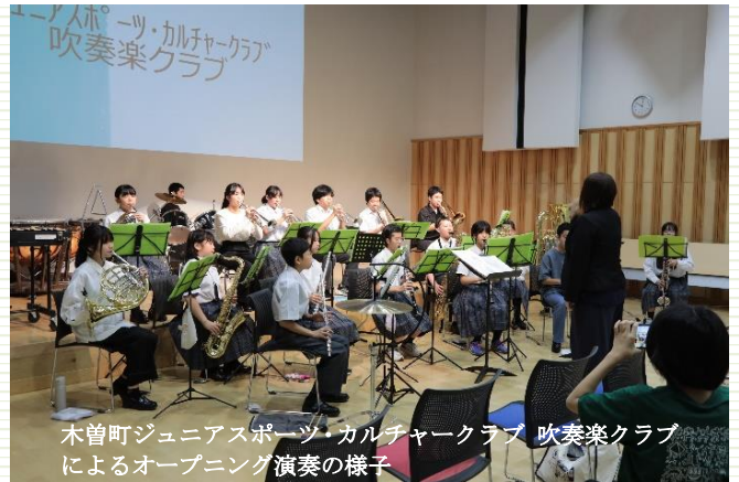
木曽町ジュニアスポーツ・カルチャークラブ 吹奏楽クラブによるオープニング演奏の様子

ほか射的やカプセルつかみなどのお楽しみコーナーも行いました。オープニングは、木曽町