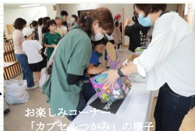
お楽しみコーナー「カプセルつかみ」の様子

お楽しみコーナーの射的、カプセルつかみ、餅つきは、ちびっこたちなど多くの方々にご参加いただきとても賑わっていました。