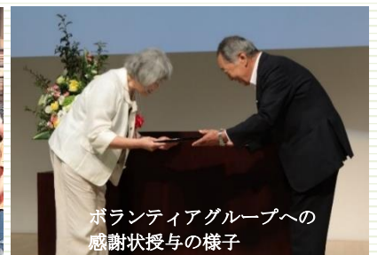
ボランティアグループへの感謝状授与の様子