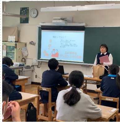
▲福祉体験事前学習

皆さまからいただきました会費は、高齢の方や障がいのある方、子どもたちの様々な活動のほか、地域福祉推進のための活動費として使わせていただきました。ありがとうございました。