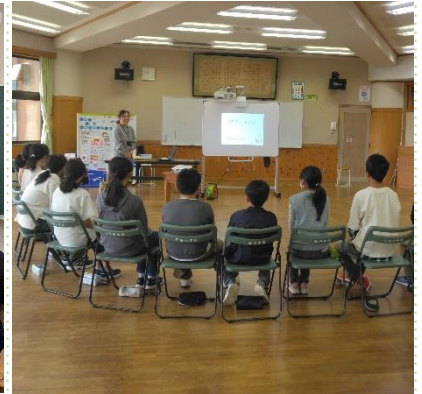
▲認知症サポーター養成講座